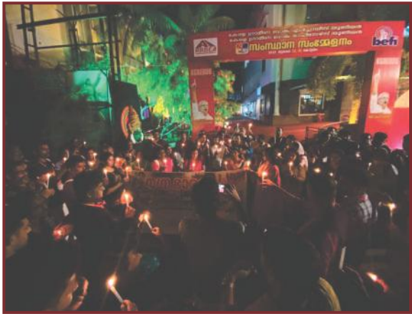
മണിപ്പൂരിലെ വനിതകൾക്കെതിരായ ക്രൂരതയ്ക്കെതിരെയുള്ള പ്രതിഷേധം

വൈകിട്ട് 9 മണിയോടുകൂടി ആദ്യദിവസത്തെ സമ്മേളനം അവസാനിച്ചു. അതിനുശേഷം പ്രതിനിധികളുടെ കലാപരിപാടികൾ കോഴിക്കോട്ട് ആരംഭിച്ചു.